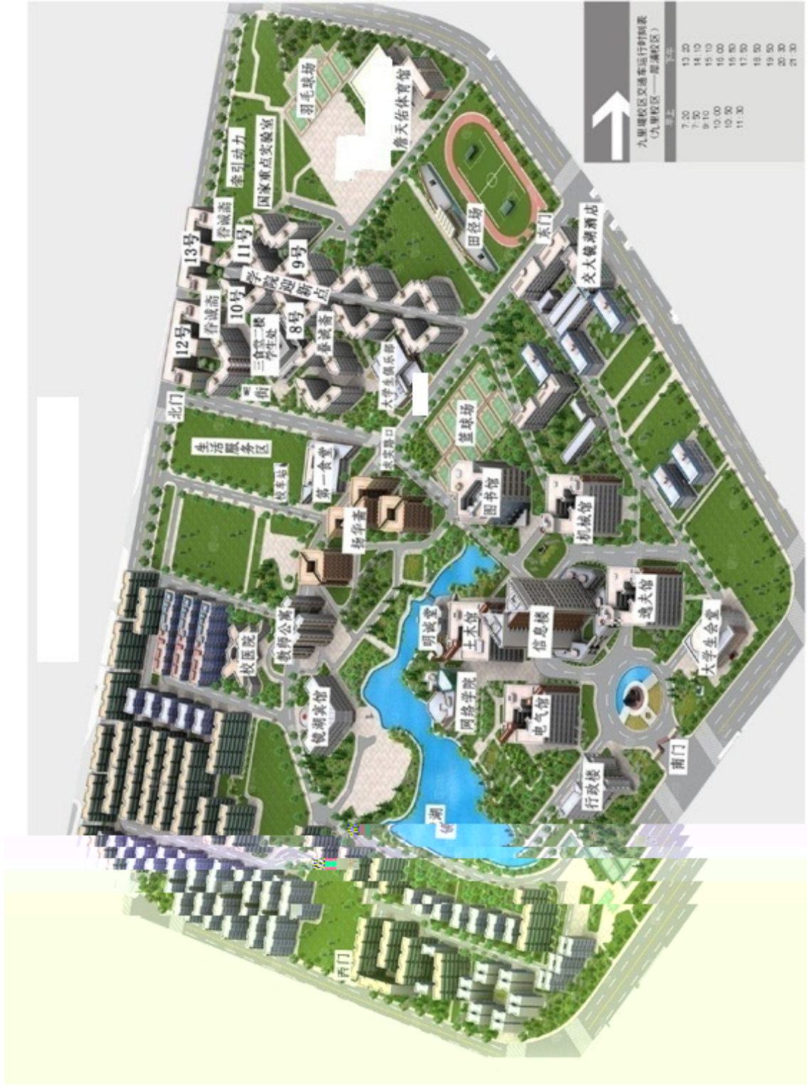
九里湖校区交通车运行时刻表 (九里校区—湖湘校区)