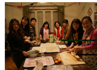
上图：驻日本使馆教育处举行中国留学生学友干部新年联欢会。