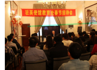
左图：2012 年驻英国使馆教育处举办新春招待会。

回调研报告 1200 余篇，编印国外教育调研材料汇编 16 期，其中 15 篇调研报告得到国家领导人重要批示。