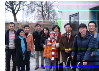
下图：驻加拿大使馆教育处教育公参春节看望加东 2 省我留学人员。